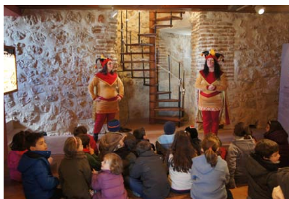
Los niños disfrutando de la visita

Nos gustó mucho y todos aprendimos un poco de cómo vivía la gente en la Edad Media.